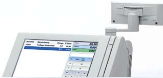
Beispiel Touchscreen-Anwendung auf Epson IR